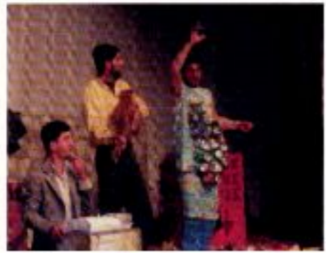
- ولهذا كان عليه ان يقرر التخلي عن اختلافات الماضي - المخرج سامان زين

إعداد وإخراج / سامان زين تمثيل / باكو سوراني - ليندا ياكو بسه - فيصل صبري - ايقيبه فان سوت الموسيقى / محمد بكر المكان / خشبة مسرح ( غايلو ) في هولندا الزمن / ٢٠١١ تموز المناسبة / مهرجان ( براباند ) الهولندي تقديم / مجموعة من الممثلين العراقيين من إقليم كردستان وهولنديين * موضوع المسرحية مستوحى من قصص ألف ليلة وليلة .. ويعد بحثاً عن جماليات الخيال - الفنتازيا - في العرض المسرحي الإيمائي الحديث والمتطور حيث يتغني على السندباد ان يقوم برحلاته وبأساليب أخرى لانه واجه ما كان ينتظره بطرق مغايرة