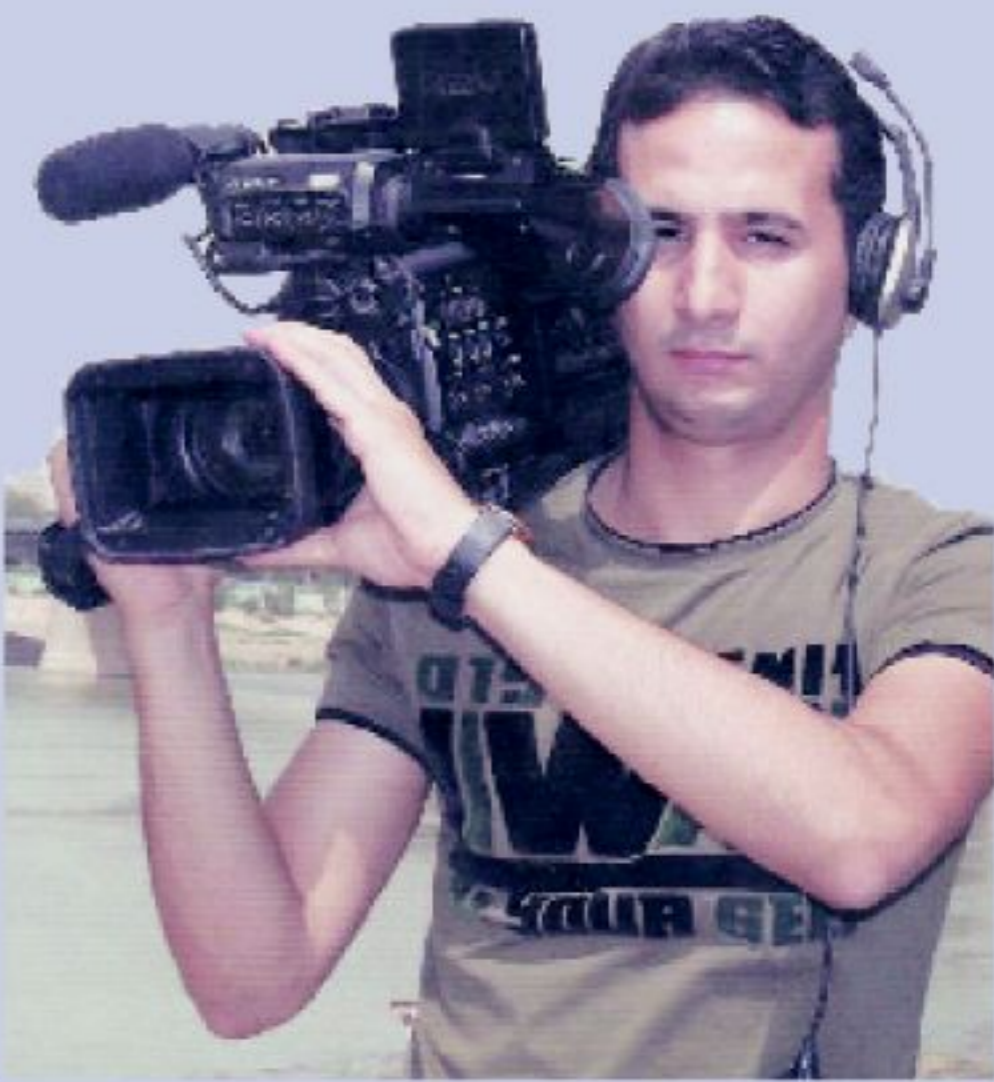
أجرى الحوار / سعدون شفيق سعيد

- أقوم بتصوير نشرة الأخبار بطريقة غير تقليدية. - وأين تكمن معاناتك اليوم؟ - في حرارة المناخ المرتفعة .. وكذلك تجمهر الناس حولنا أثناء التصوير مما يعيق حركة الكاميرا. - وخلال رحلتك مع التصوير.. أين نجد عشقتك؟ - أحب تصوير البرامج الميدانية التي أقوم بتصويرها في مواقع العمل أو الشارع لأنها بعيدة عن تقييد المكان والكاميرا. - وللتخصصات؟ - أن تجد الناس يحولون بين عشقتك من خلال التجمهر لكونهم لا يفهمون ماذا يعني التصوير الميداني وإبداعنا وخاصة في هذا الجو اللاهب. - مواقف تعترّ بها؟ - ذات يوم وفي سيطرة العمارة بالذات طلب رجال الأمن ان يبقوا معهم ليلا.. لأن الطريق كان غير آمن لخوفهم علينا.. فبقينا معهم نتسامر معهم طوال الليل وبهذه المناسبة تقدم لهم شكريا على موقفهم النبيل هذا وكانوا وبحسب حريصين كل الحرص على ان يشعرونا اننا بين عوائلنا. - واخيرا .. ما الذي تعلمته أثناء تواجده في الديار؟ - حقا ان الديار بالنسبة لي كانت ولا تزال مدرسة أسسها الفنان الكبير فيصل الياسري.. حيث تعلمنا فيها كل فنون العمل الذي تتطلبه القناة الفضائية.