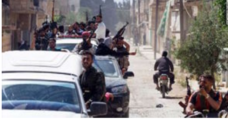
بغداد / ترجمة المستقبل العراقي

بعد أن استعاد جيش النظام السوري سيطرته على كامل العاصمة السورية دمشق وكسبه للحرب النهائية التي كانت قوات المعارضة تهلل لها، بعد تلك المعارك الطاحنة، وفي هذه اللحظة بالذات من الممكن أن تكون دمشق هي الناجية الوحيدة من تدمير الإرث الثقافي والآثار، هذا التدمير الذي وصل إلى الآثار الموجودة في المدن