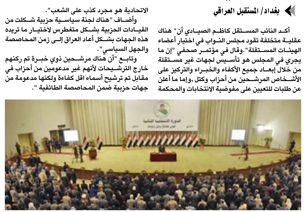
بغداد / المستقبل العراقي

الاتحادية هو مجرد كذب على الشعب." وأضاف "هناك لجنة سياسية حزبية شكلت من القيادات الحزبية بشكل متعطر لاختيار ما تريده هذه الجهات بشكل أعاد العراق إلى زمن المحاصصة والجهل السياسي". وتابع "أن هناك مرشحين ذوي خبرة تم كنهم خارج الترشيحات لأنهم غير مدعومين من أحزاب في مقابل تم ترشيح أسماء أقل كفاءة ولكنها مدعومة من جهات حزبية ضمن المحاصصة الطائفية".