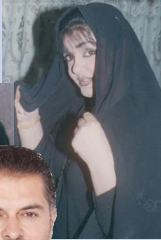
وهل سمحت لك بالسفر إلى

الخارج كمطربة عراقية؟ - لولاها شهوتي في هذه الأغنية لما استطعت السفر إلى الخارج وأوجدت في حضوري فنيا هناك.. حيث شاركت في المهرجانات المقامة في الخارج ومنها على سبيل المثال مهرجان جرش في الأردن.. حتى بات في جمهور واسع في البلاد العربية.. ومنها الدول الخليجية.