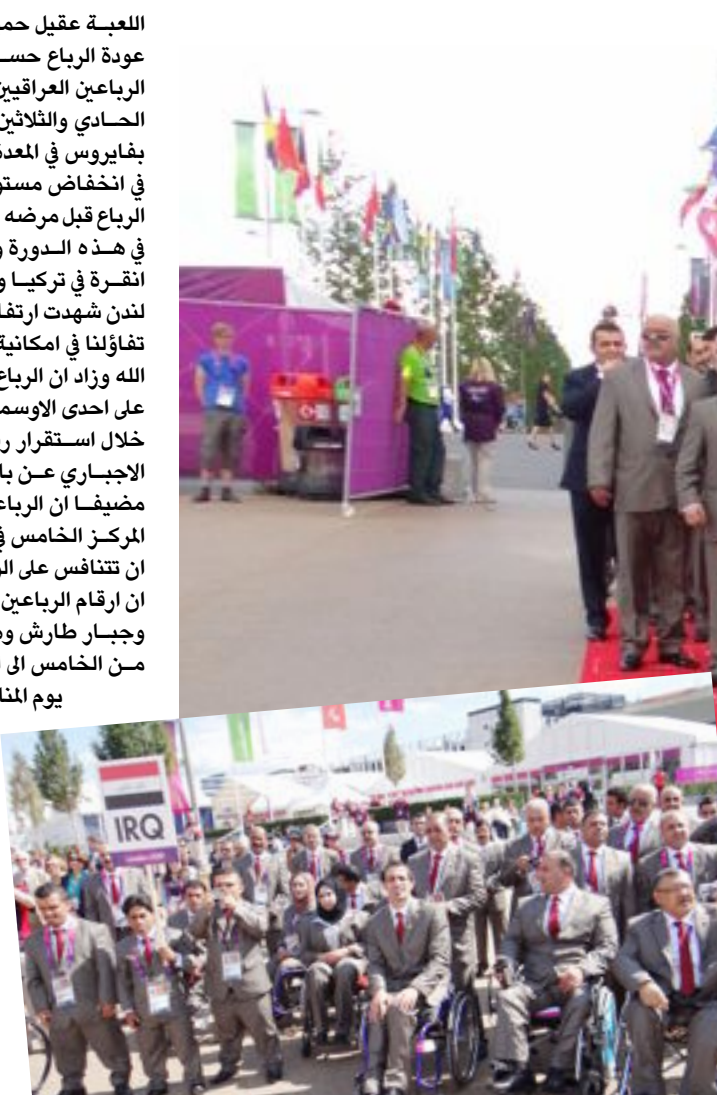
جميعهم مصابون بشلل الأطفال

يحتضن ملعب الشعب الدولي في الساعة السابعة من مساء اليوم الاثنين تدريبات المنتخب الوطني بكرة القدم استعداداً لمباراته في إطار الجولة الثالثة لتصفيات المرحلة الأخيرة من مونديال البرازيل ٢٠١٤ إلى جانب منتخبات اليابان وأستراليا والأردن وسلطنة عمان، وسبق له أن تعادل مع المنتخبين العربيين وأمامه مواجهة مهمة قادمة مع منتخب اليابان القوي، متصدراً المجموعة بسبع نقاط، ستقام في العاصمة طوكيو يوم ١١ أيلول سبتمبر المقبل. وحصل العراق على نقطتين من مباراته والسابقين، وهو يحل حالياً في المركز الثاني ويليه منتخب أستراليا بفارق الأهداف. ويتأهل فريقان عن المجموعة، فيما يلعب الفريق صاحب المركز الثالث في ملحق عقده قبل أن يتأهل للنهائيات.