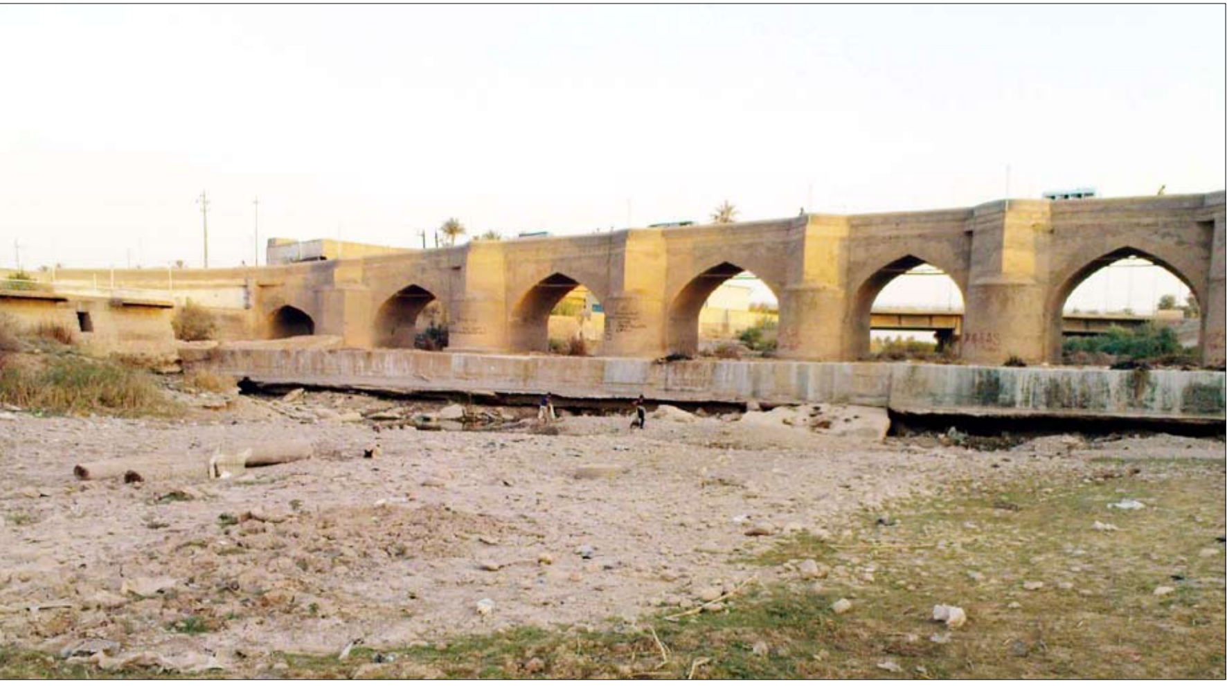
● نهر الوند في محافظة ديالى يتحول لملاعب كرة صيفا

يلاحظ مراقبون أن الدعوات المتتالية لتثبيت حقوق العراق المائية عبر اتفاقات رسمية مع تركيا وإيران وسوريا لم تصل الى نتائج فعلية، فمزال أغلب ما يصل العراق من مياه نهري دجلة والفرات مرهونًا ببارادة