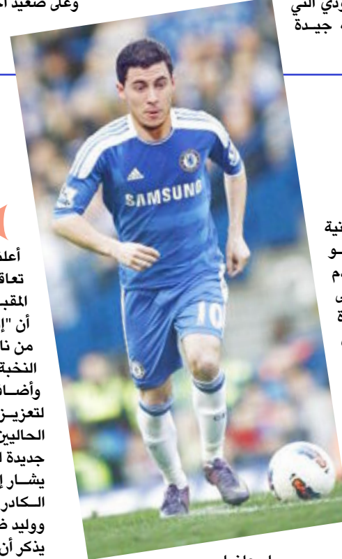
ماجعلنا بحالة جيدة، وأتمنى الإستمرار على تحقيق الفوز والإستمتاع باللعب. وهذا