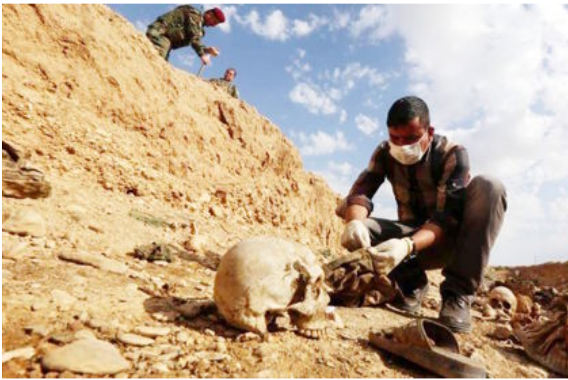
العراقي» نسخة منه، إن «تصريحات الجار الله هي أول اعتراف رسمي بالجرم الذي ارتكبه الجيش العراقي في حق المدنيين العراقيين، وهذا خطوة جيدة ستختصر الوقت كثيراً في جعل الأمم المتحدة تباشر في فتح هذا الملف

والتحقيق فيه ثم إصدار قراراتها بحق الكويت، أما بشأن ادعائه بأن الضحايا ليسوا عراقين فهو يحاول من خلاله تغطية الشمس بالغراب... وأضافت أن «الكويتيين صدعوا رؤوسنا بملف المفقودين الوهميين الذين لا وجود لهم، وأخذوا تعويضات تعسفية من قوت الشعب العراقي وبمساعدة الفاسدين الذين قبضوا الرشا منهم، واليوم وجدوا أنفسهم في زاوية ضيقة بعد الكشف عن هذه الجريمة التي لن نسكت عنها وسنعمل على تدويلها ونطالب بتعويضات عنها لأسر الضحايا وللعراق كحق عام...» وأكدت نصيف، أن «شهادة الشرطي الكويتي بحصول الجزرة على أيدي سلطات بلاده بحق خمسين عراقياً موثقة بالصورة والصوت، والكلام واضح لا لبس فيه وسيكون هذا التسجيل من بين الأدلة التي ستوضع على طاولة الأمم المتحدة، وإذا اتهم الجار الله هذا الشرطي بأنه جاهل بجنسيتهم فاللهجة العراقية معروفة تماماً وأول من يعرفها هم الكويتيون».