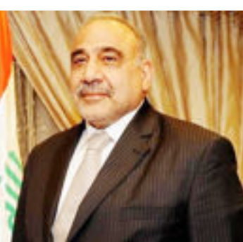
البنية لشعورها بتحقيق الاستقرار وتعزيز الأمن والحياة الديمقراطية». وقدم رئيس مجلس الوزراء مبادرة للشراكة والتعاون الاقتصادي والعمراني بين الحكومتين العراقية واليابانية تتضمن الدعوة لإنشاء صندوق مشترك لتمويل مشاريع الإعمار عن طريق كميات النفط العراقي المصدر لليابان كما يمول الصندوق من الجانب الياباني تشجيعاً للشركات اليابانية المعروفة

العامة في العراق، وستقدم الحكومة العراقية حزمة من المشاريع بطريقة تضمن نجاح عمل الشركات اليابانية وتسريع جهودها وانسيابية عملها، بحسب البيان. وأضاف عبد المهدي، ان «هذه المبادرة ستعزز العلاقة بين البلدين بشكل اكبر وتسرّع من جهود الإعمار وإنشاء المشاريع الاقتصادية وتوفر فرص عمل للعراقيين الى جانب تنويع روثه الوطنية وتقليل الاعتماد على النفط، كما توفر فرصاً لمقابلة