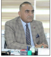
القاضي عبدالستار بيرقدار