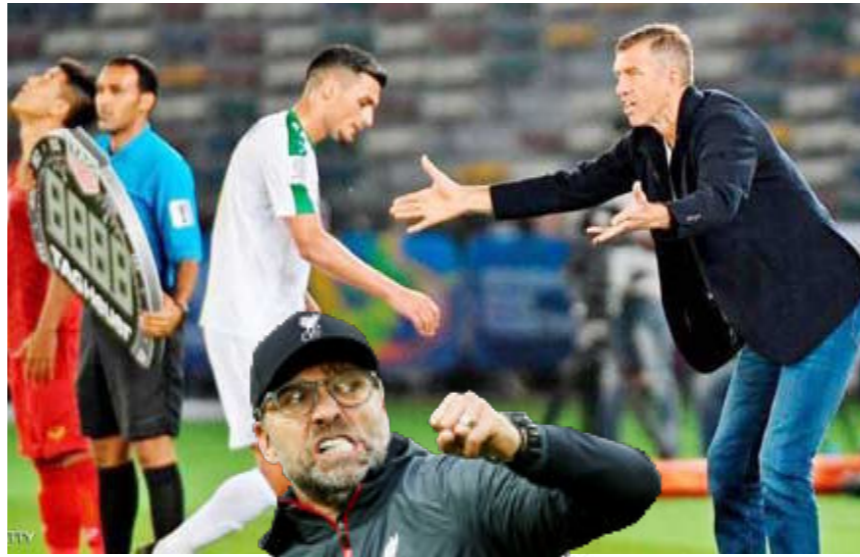
خياراته، وقد نجح في التصفيات المزوجة بتصدر المجموعة

وبدأ الحراك في الجيش الإلكتروني في محاولة الضغط على المدرب والتأثير على خياراته، دون التمهّل لمناقشة القائمة بحياء، وجاء الرد بعد دقائق معدودة، بنقد لانع كاتانيتش وطاومه. الاستقرار الفني ولم تشهد قائمة كاتانيتش تغييراً كبيراً وهذا طبيعي، وهو ما يشير إلى رغبة المدير الفني كأي مدرب محترف في البحث عن الاستقرار في تشكيلته، وليس إجراء تغييرات جذرية مثلما يطالب من هاجموه. المدرب تعامل مع بعض الأسماء وحقق معها تقدماً فنياً من خلال فهم ميزات اللاعب وتوظيفه حسب قابليته الفنية وكذلك لانسجام الفريق كمجموعة فيما بينها وقدرتها على هضم فلسفة كاتانيتش. تلك التفاصيل مهمة جداً للمدرب تسعى لترسيخها بالمنتخب خلال الفترة الماضية ولا يمكن نسفها، لذا تسعى للحفاظ على استقرار القائمة. صدارة المجموعة ما يفند الانتقادات لكاتانيتش تمسكه وثقته