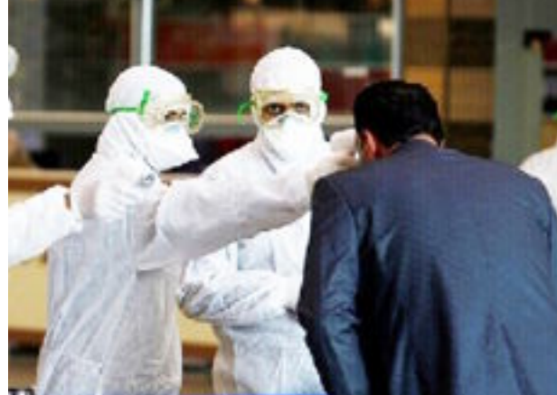
بغداد / المستقبل العراقي

أعلنت وزارة الصحة والبيئة، أمس الثلاثاء، تسجيل ٣٥٩٥ إصابة جديدة بفيروس كورونا. وذكرت الوزارة، في بيان تلقت المستقبل العراقي نسخة منه، أنها سجلت ٢٩٧٩ حالة تعافى من فيروس كورونا، وإصابة ٥١، و٥١ وفاة. وأشارت إلى أن عدد الإصابات الكلي بلغ ٤٨٢٢٩٦، وعدد الوفيات الكلي بلغ ١١٠٦٦. وأظهر الموقف اليومي الذي نشرته الوزارة، ليوم أمس الإثنين، تسجيل ٣٤١٣ إصابة جديدة بكورونا، و٢٩٩٥ حالة شفاء، فضلا عن تسجيل ٥١ حالة وفاة.