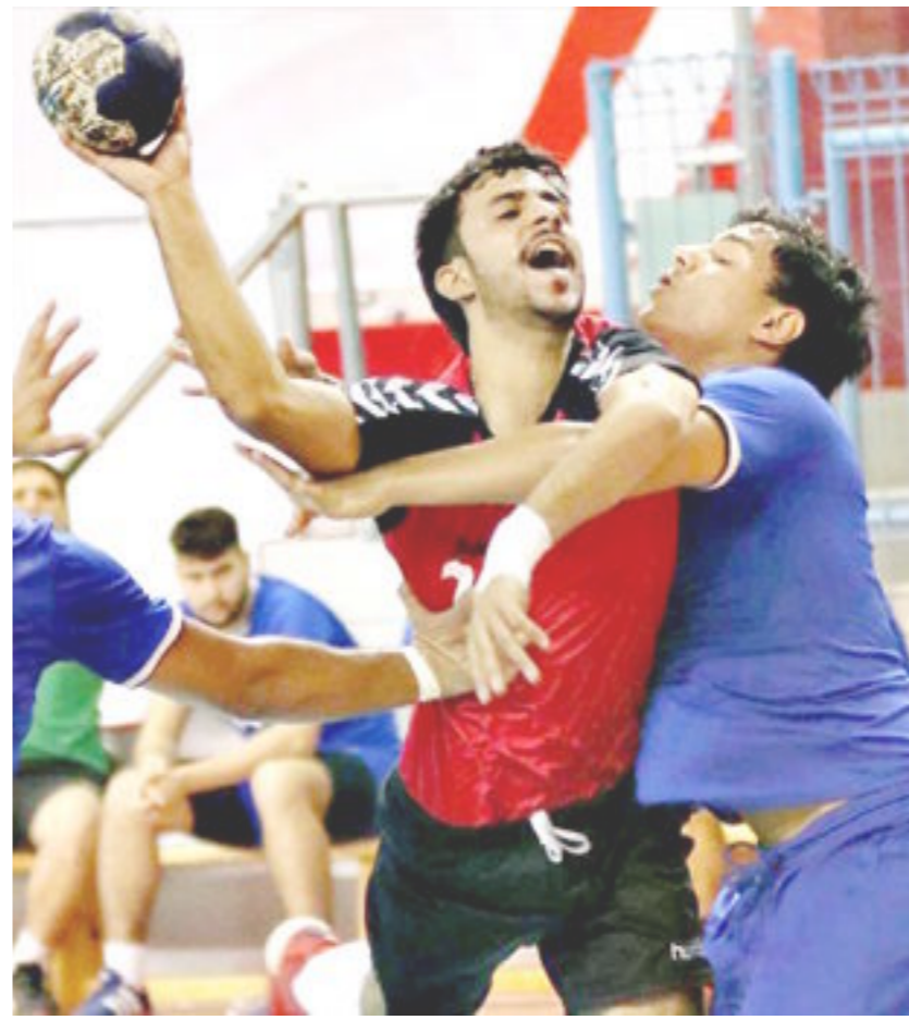
المستقبل العراقي / متابعة

انطلقت في العاصمة الاردنية عمان بطولة اسيا بكرة اليد بمشاركة اثني عشر منتخب اسوي وسبق انطلاق البطولة المؤتمر الفني بحضور ممثلي المنتخبات المشاركة وادار المؤتمر الفني للبطولة علي عيسى رئيس اللجنة الفنية في الاتحاد الاسيوي حيث وزعت المنتخبات حسب القرعة الى اربعة مجموعات حيث ضمت المجموعة الاولى منتخبات الاردن وايران واوزبكستان وفي المجموعة الثانية منتخبات اليابان والسعودية وفلسطين اما المجموعة الثالثة ضمت منتخبات كوريا الجنوبية والبحرين والهند اما المجموعة الرابعة ضمت منتخبات العراق وقطر والصين هذا وجرت القرعة بقاعة الاميرة سمية بنت الحسن في المدينة الرياضية في الاردن.