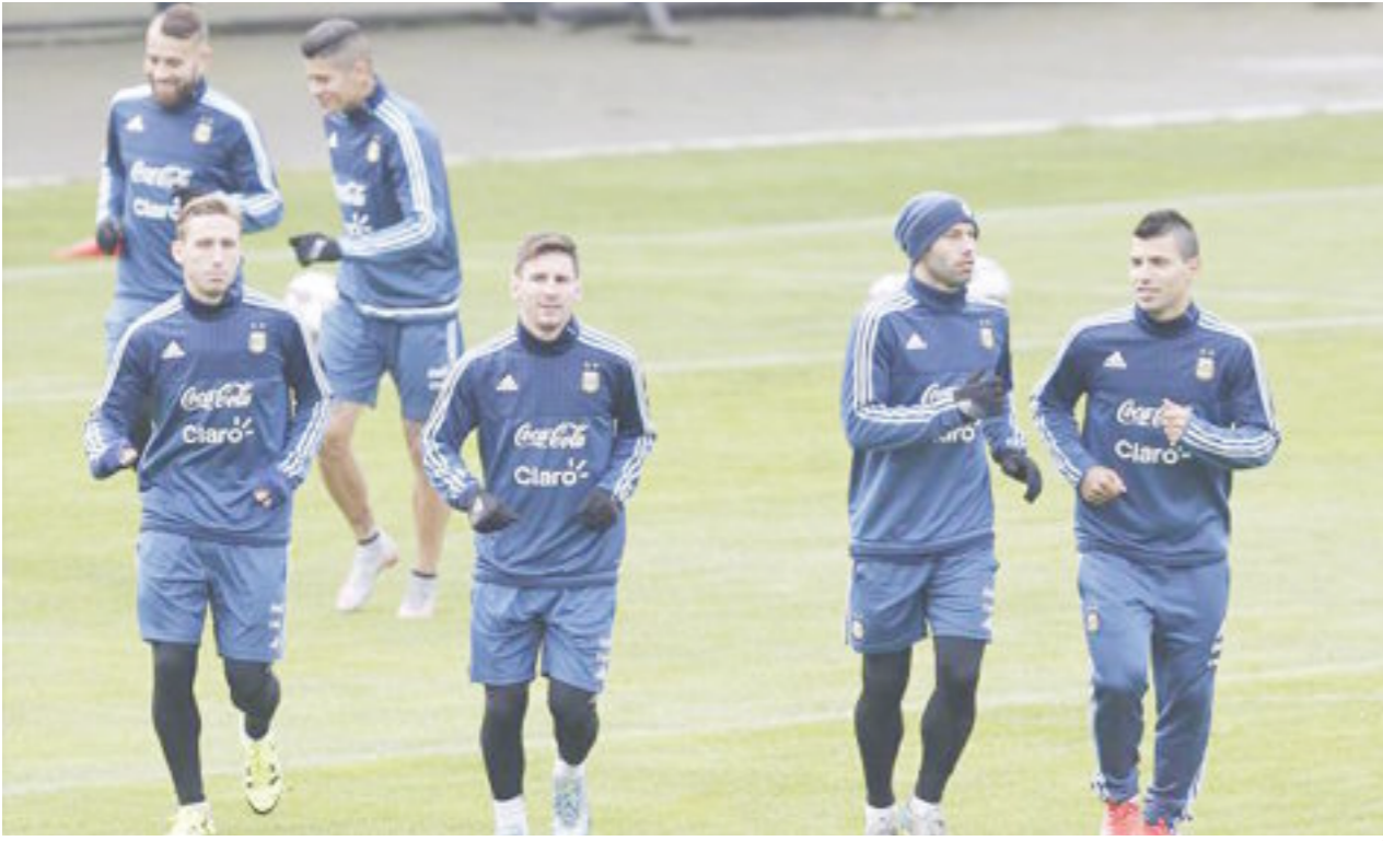
المستقبل العراقي / وكالات

روساريو سنترال ولانوس وبوكا جونيورز. وقال بيريز عقب الاجتماع في تصريحات إذاعية "اجتمعت لتوي مع بيريز، وهو الأمر ذاته الذي حدث مع باوزا. جميع الاحتمالات قائمة، وسيتم اتخاذ القرار الأفضل في اللعبة في البلد اللاتيني، أرماندو بيريز. وبدأ الاتحاد فعلياً عملية البحث عن خليفة المستقبل من منصبه، خيراو دو "تاتا" مارتينو عقب خسارة لقب كوبا أمريكا (المئوية) أمام تشيلي الشهر الماضي.