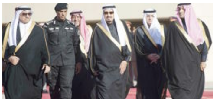
العرب يتهافتون على إسرائيل 4 ص

يجب أن نسلح الراس أولاً قبل أن نسلح الأيدي «مكسيم غوركي» رئيس مجلس الإدارة رئيس التحرير علي الدراجي