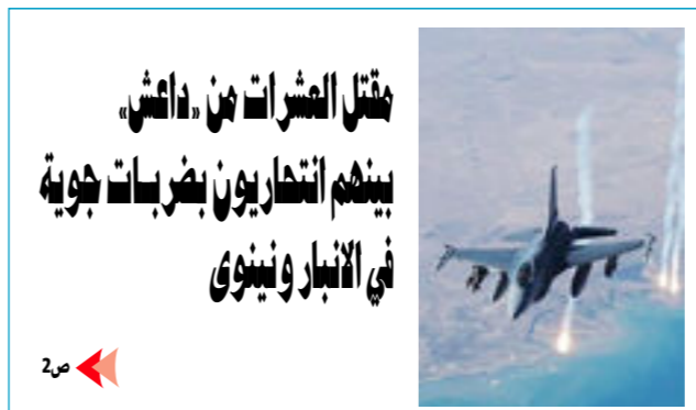
مقتل العشرات من داعش. بينهم انتحاريون بضربات جوية في الأنبار ونيقوى