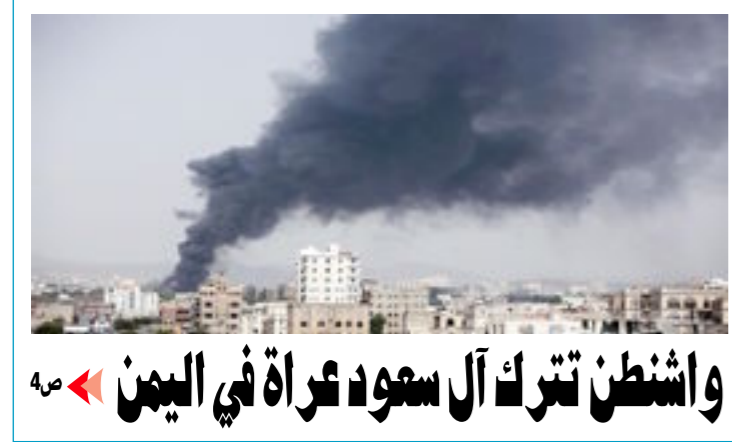
واشنطن تترك آل سعود عمارة في اليمن

إن النصر الناتج عن العنف مساو للهزيمة، إذ إنه سريع الانقضاء «غاندي»