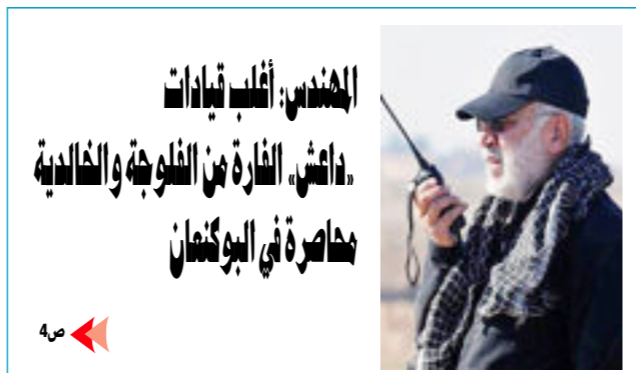
المهندس: أغلب قيادات داعش، الفارة من الفلوجة والخابدية مضارة تي البوكنان