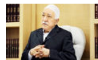
غولان من شاشة العربية: أروغان طاغية، وفنانة لأهلية

بعد حلحلة أزمة النفط بين بغداد وإقليم كردستان، لاسيما بعد أن أعيد العمل بضمخ النفط الخام من حقول تشغيلها شركة نفط الشمال عبر خط أنابيب إقليم كردستان إلى تركيا، عادت الخلافات بشأن الحرب على تنظيم «داعش»، ونية إقليم كردستان اقتطاع أراضي من نينوى لتؤجج الخلافات من جديد. وقد أعادت الحكومة الاتحادية العمل بضمخ النفط الخام من حقول تشغيلها شركة نفط الشمال عبر خط