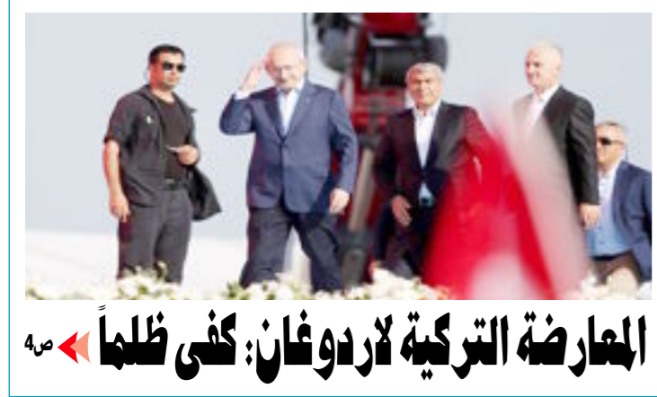
المعارضة التركية لاردوغان: كفى ظلماً

من يجعل من نفسه دودة ليس له أن يتذمر إذا ما داسته قدم