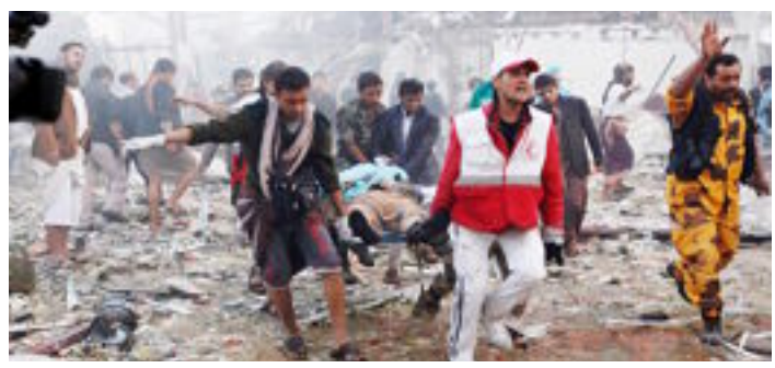
السعودية «مجرمة» أمام العالم» ص 4