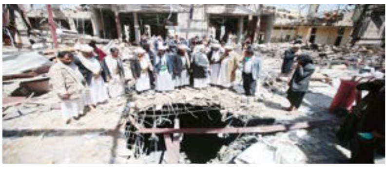
هل ينهي ترامب دعم السياسات السعودية «الوحشية»؟