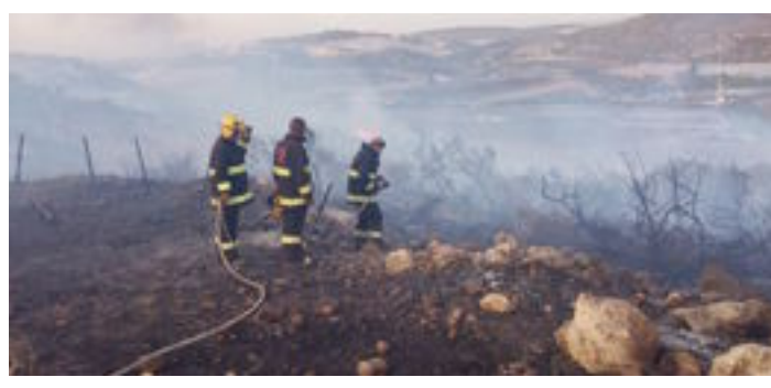
دول عربية شاركت بـ «إطفاء» هرائق إسرائيل << ص 4

العلم خير من المال العلم يحرسك وانت خرس المال «الإمام علي بن أبي طالب(عليه السلام)» رئيس مجلس الإدارة رئيس التحرير علي الدراجي