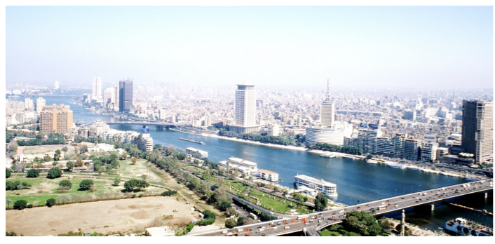
إسرائيل تريد «النيل» ليروي عطشها» ص4

رحم الله إمرء أحي حفاً وأمات باطلاً ودحض الجور وأقام العدل «الإمام علي بن أبي طالب(عليه السلام)»