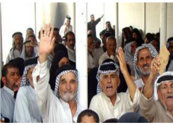
بغداد / المستقبل العراقي

حددت دائرة التقاعد والضمان الاجتماعي للعمال التابعة لوزارة العمل والشؤون الاجتماعية، اليوم الخميس، موعداً لصف رواتب العمال المضمونين وخلفهم المستحق لفتتي (الصف البديوي، وحاملي البطاقة الذكية) لشهرين الثاني وكانون الاول لعام 2016 في بغداد والمحافظات.