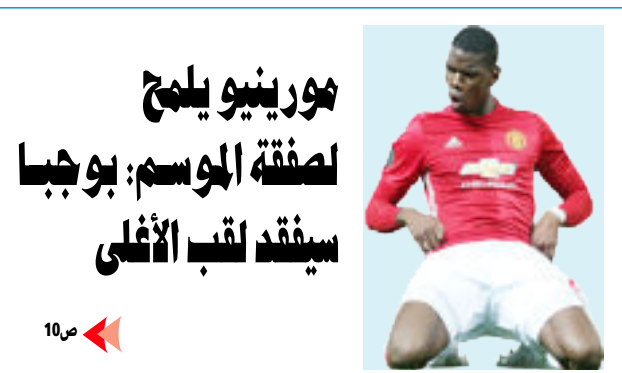
موريني يلحج لصفقة الموسم: بوجبا سينفذ لقب الأعلى