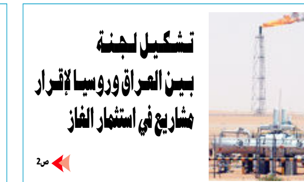
تشكيل لجنة بين العراق وروسيا لإتراء مشاريع في استثمار الغاز