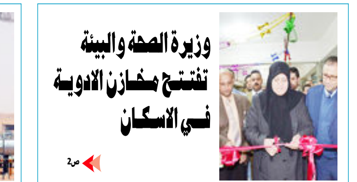
وزيرة الصحة والبيئة تفتتح مخازن الأدوية في الاسكان