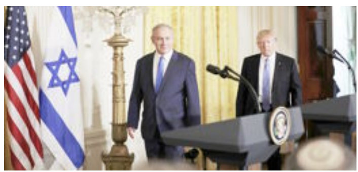
ممالك الخليج تملق الكيان الصهيوني

أربعة من أخلاق الأنبياء «عليهم السلام» البر والسخاء والصبر على النانية والقيام بحق المؤمن