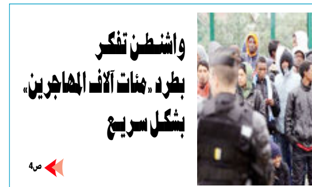
واشنطن تفكر بطرد «مئات آلاف المهاجرين» بشكل سريع