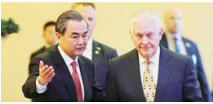
تهديدات بيونغ يانغ تفرض الصلح بين واشنطن وبكين

أربع لا تجزي في أربع الخيانة والغلول والسرقة والربا لا تجزي في حج ولا عمرة ولا جهاد ولا صدقة