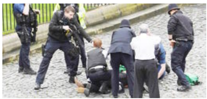
لندن تشعر بالقلق من مخططات إرهابية أخرى << ص 4

الرغبة في الدنيا تورث الغم والحزن والزهدي في الدنيا راحة القلب والبدن