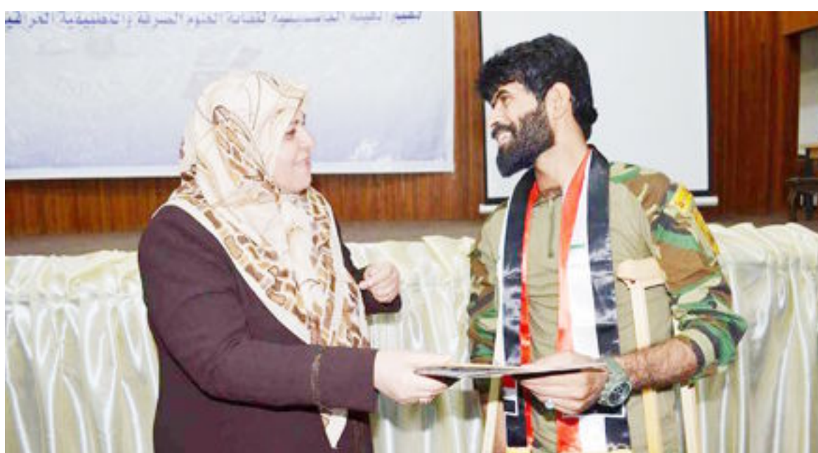
مجلس الوزراء - استضافة لواء المغاوير في محافظة ميسان

أكدت السيدة وزيرة الصحة والبيئة الدكتورة عديلة حمود حسين حرص الوزارة وسعيها الدؤوب على الاهتمام بالاكالات العلمية من خريجي كليات العلوم وتمكينهم من أخذ دورهم الاساسي و المهم ضمن المنظومة الصحية الوطنية من خلال تبني البرامج والخطط التي من شأنها المساهمة في تطوير تخصصاتهم وتحديث انظمة العمل وبما ينعكس بالايجاب على جودة وتحسين الخدمات الوقائية والطبية والعلاجية المقدمة الى المواطنين . وأشارت خلال حضورها المؤتمر السادس لخرجي كليات العلوم الذي اقامته الهيئة التأسيسية لنقابة العلوم الصرفة والتطبيقية العراقية اليوم الجمعة ٢٠١٧/٤/١٤ تحت شعار «علم والعلوم نلتقي ونرتقي» بحضور بعض مجلس النواب السيد خالد الاسدي رئيس الكتلة النيابية لحزب الدعوة تنظيم