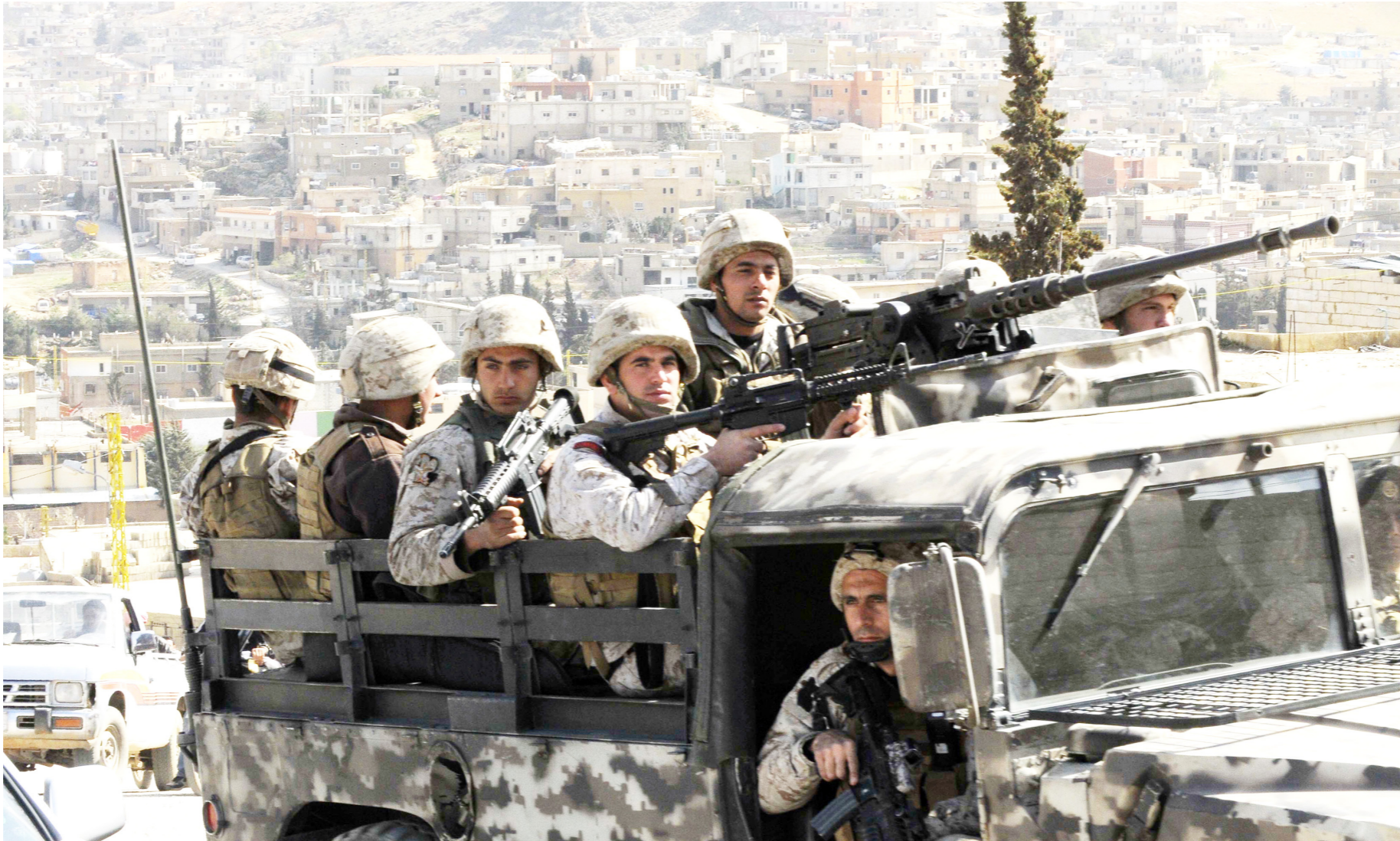
ساحتها بـ ٢٩٦ كلم مربع، منها ١٤١ كلم مربعا في لبنان. وبالتزامن مع عملية الجيش، أعلن حزب الله اللبناني السبت عن بدء الحملة ضد تنظيم «داعش» بالتعاون مع الجيش السوري على الجهة السورية من الحدود أيضا. ونقل الاعلام الحربي التابع لحزب

ويسيطر تنظيم «داعش» على منطقة جبلية واسعة جزء منها في شرق لبنان والأخرى في سوريا. وتقدر