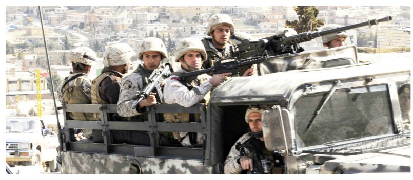
لبنان يخوض «معركة واحدة» لطرد «داعش»

إنّ النفس لجوهرة ثمينة، من صانها رفعها ومن ابتذلها وضعها «الامام علي بن أبي طالب (عليه السلام)»